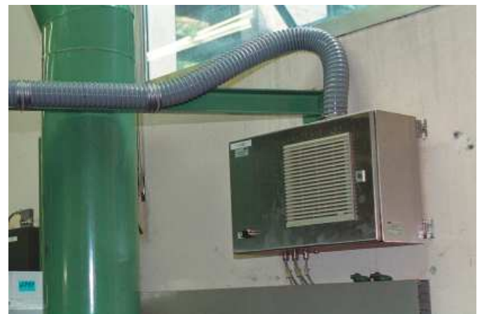
Gebläselufterzeugung und Anschlußbox für VLM 200 SD Geräte

des Sensors, die über viele tausend Exemplare identisch ist, und sichern damit eine gleichbleibende Qualität. Da