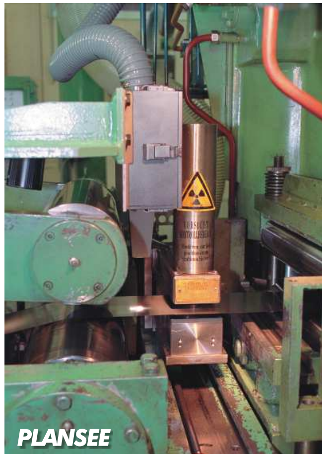
VLM 200 SD Gerät im SUNDWIG 20-Roller (linke Seite)

Die High-Performance eines 20-Rollen Walzgerüsts kann erst mit moderner elektronischer Regelungstechnik zum Erreichen hoher Bandqualität umgesetzt werden. Die modernen Konstantvolumenregelungen verlangen zuverlässige dynamische Geschwindigkeitswerte, die vorteilhaft mit dem VLM 200 SD erfaßt werden können. Dies eröffnet neue Möglichkeiten zur Realisierung exakter Banddicken.