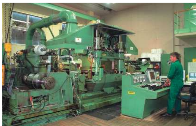
Steuerpult des Walzgerüsts

Zur Unterstützung dieser hohen Anforderungen wurde das Herzstück der Bandproduktion, das SUNDWIG 20-Rollen-Walzwerk aus dem Baujahr 1980 im Jahr 2000 durch den Einbau einer vollhydraulischen Anstellung und einer neuen Dickenregelung modernisiert. ▶